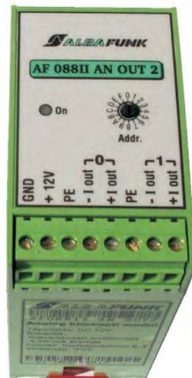
AF088II AN OUT 2 áram kimenettel