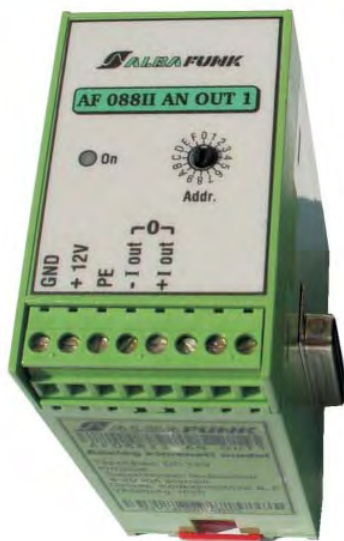
AF088II AN OUT 1 áram kimenettel